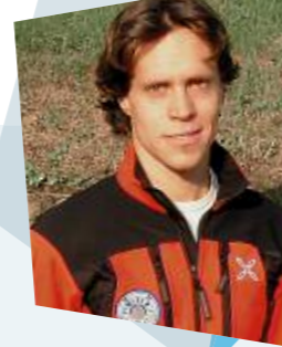
— Georg Hofer DT/IT/EN

Robert works full-time as a mountain guide. He lives in the Passeier Valley and loves to cross the mountains of the Schnals Valley with or without skis. For twenty years now, Robert has accompanied journalists and those in search of adventure several times a week to the discovery site of Ötzi. "I like the Ötzi tour a lot. Both in summer and winter alike, I am inspired by the high-elevation landscape in a special way."